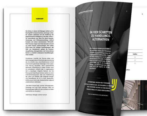
Mit Simulation zu datenbasierten Entscheidungen