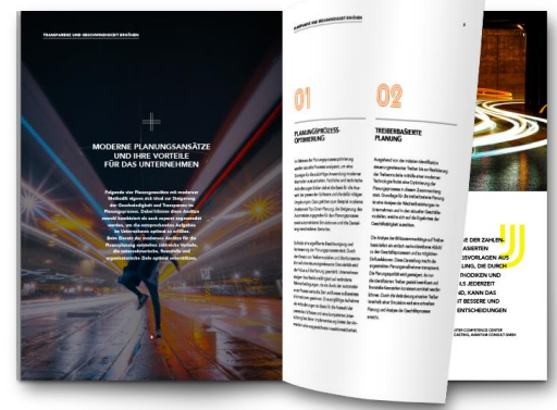
Transparenz & Geschwindigkeit im Planungsprozess erhöhen