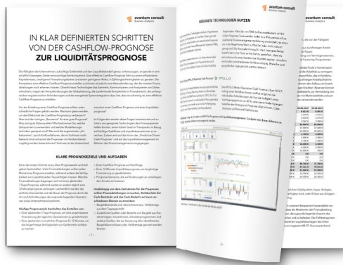
In 8 Schritten von der Cashflow- zur Liquiditätsprognose