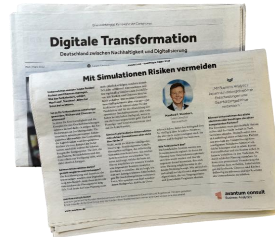
Mit Simulationen Risiken vermeiden DIE WELT // März 2022